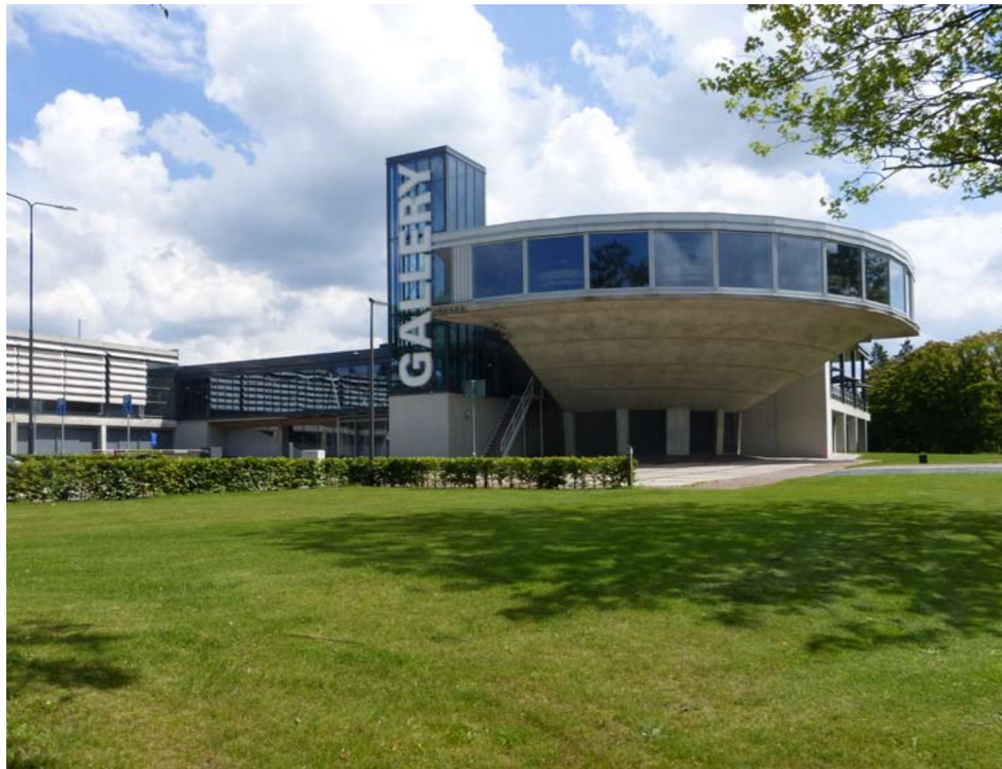
The Gallery Universiteit Twente OD205 architectuur kennispark