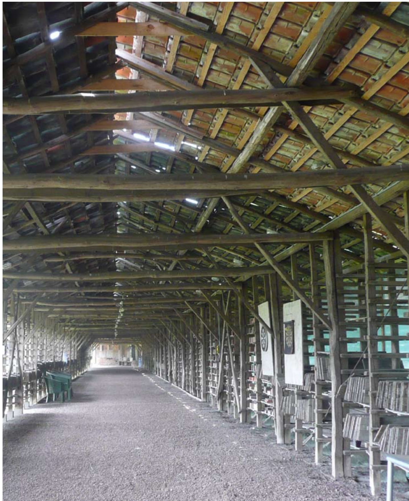
Steenfabriek De Werklust Losser TAK architecten, Delft Industrieel monument