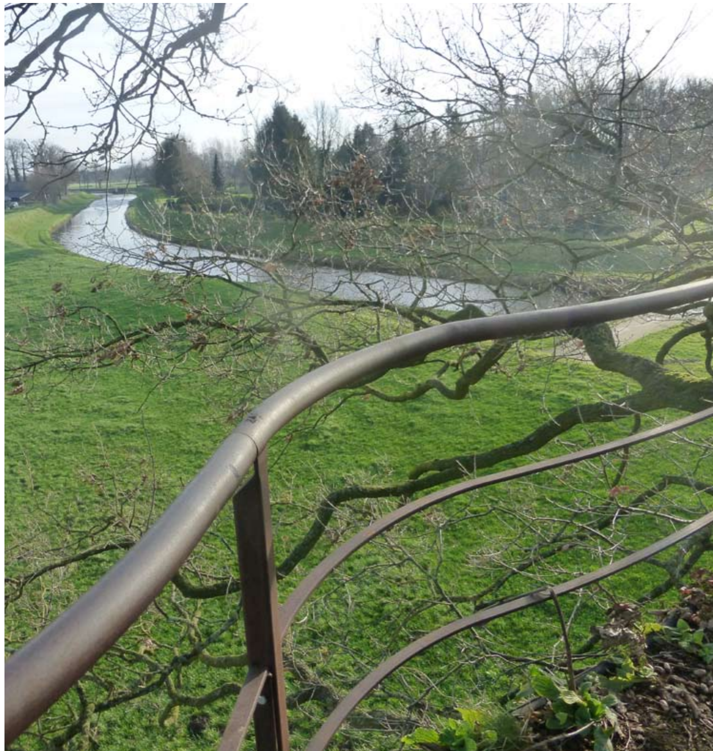
De Regge nabij Diepenheim