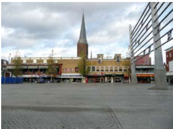
Hengelo, Markt De Top van Bisschoff