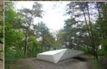
Laag van Usselo [aardkundig monument]